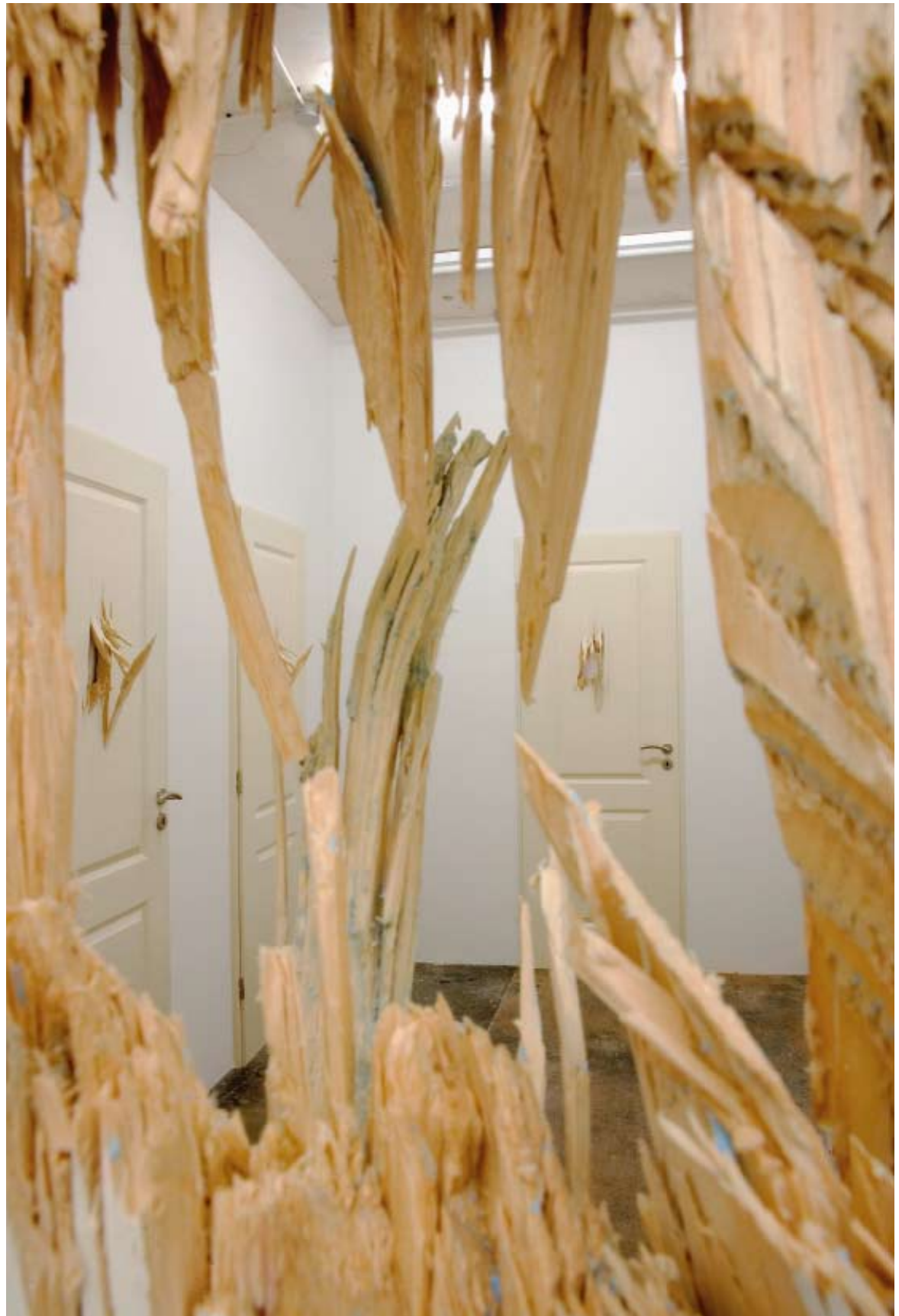
Christoph Weber: „Trauma“, 2008. Mixed media, Dimension variabel (Ausstellungsansicht: Galerie Jocelyn Wolff, Paris, 2008)

und neuerlicher Aufbau also nur durch vorherige Zerstörung möglich ist.