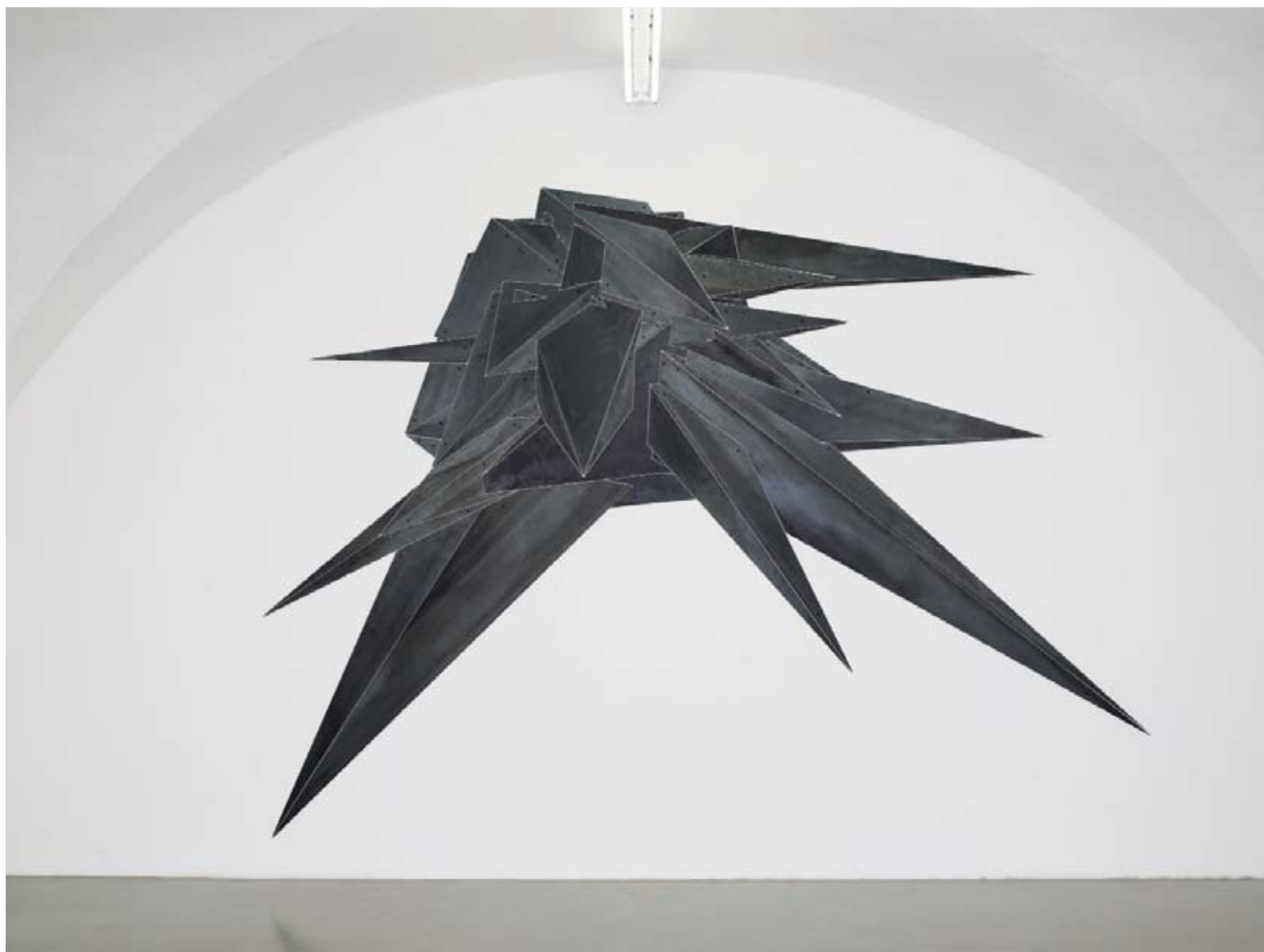
Christoph Weber: „The First Minutes of October“, 2007. Stahl, 290 x 399 x 0,6 cm (Ausstellungsansicht: Neue Galerie Graz Studio, 2007)

den Betrachter dramatisch um die Statue herumführt, analysiert. Mithilfe einer Architekten Software ist eine Zeichnung in Form eines unregelmäßigen Sterns entstanden, die die Sehpyramiden von Eisensteins Kamera und damit den gefilmten Raum repräsentiert. Schließlich wurde sie als flache, an die Wand montierte Skulptur aus einzelnen nicht miteinander verbundenen Stahlsegmenten ausgeführt. „Methodologisch ist die Rekonstruktion von Eisensteins Kameraeinstellungen ein Nachvollzug der konstruktivistischen Zeit“ 2 , schreibt der Künstler selbst über diese Arbeit. Sein „Nachvollzug“ erschöpft sich aber nicht allein in der Anwendung einer konstruktivistischen Technik, in der Fragmentierung, der Gegenüberstellung und Zusammensetzung einzelner Versatzstücke. Die Transformation von der zeitlich ablaufenden, bewegten Filmsequenz in eine martialisch anmutende, geschlossen wirkende Stahlskulptur, die scheinbar unverrückbar ihren Platz an der Wand verteidigt bewirkt eine kontextuelle Verschiebung; sie kann als Symbol von Gewalt, der Vereinnahmung und Durchschlagskraft gelesen werden oder – aus heutiger Sicht – als Verweis auf den kommunistischen Stern und damit als visuelle Metapher für die Utopie des Sozialismus gedeutet werden.