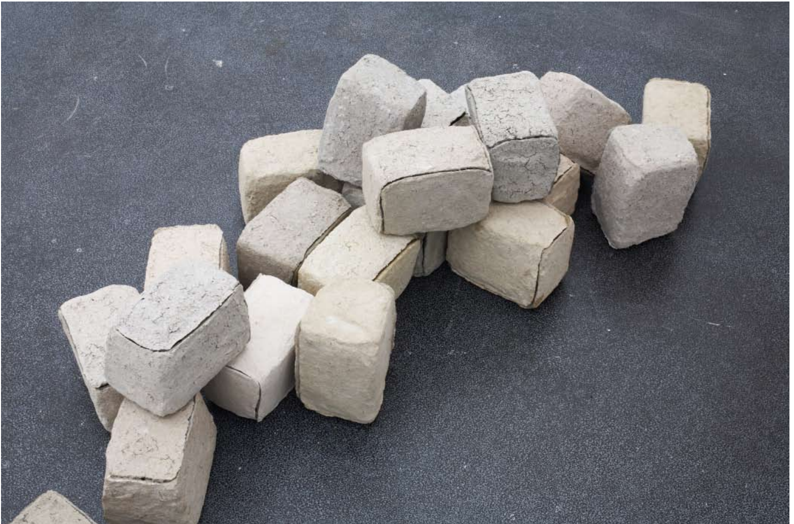
Christoph Weber: „Untitled (Rampeau)“, 2008. Papiermaché, Dimension variabel

Alexander III. zeigt, schrieb Eisenstein durch die verschiedenen Kameraeinstellungen und die präzise Schnitttechnik Filmgeschichte. Christoph Weber hat alle Kamerapositionen, mit denen Eisenstein