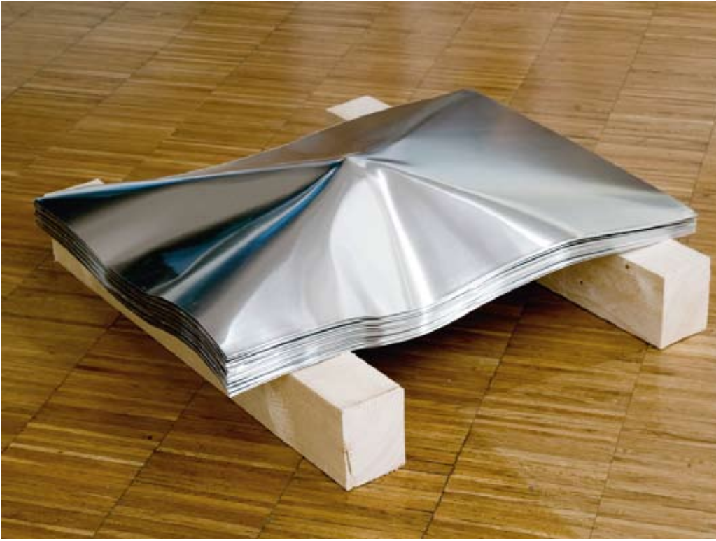
Christoph Weber: „Stack“, 2008. Aluminium, Holzstaffeln, je 49 x 65 cm (Ausstellungsansicht: Bawag Contemporary, Wien, 2008)

und auf sechs identische Türen übertragen. Das Arrangement der Türen zu einem geschlossenen Raum, in den durch das Loch der originalen Türe auf die scheinbar identisch gebrochenen Kopien geblickt werden kann, verweist auf die zerstörerische Seite des Menschen und die psychischen Traumata sowohl beim Täter als auch beim Opfer. Für die Installation „Stack“ (2008) hat Weber eine verbeulte Aluminiumplatte vervielfältigt und übereinandergestapelt. Sie kann wiederum als Verweis auf ein industrielles System gelesen werden, das, unbeeinflusst von menschlichem Handeln, versagt und durch die Produktion von Fehlern Kettenreaktionen auslöst.