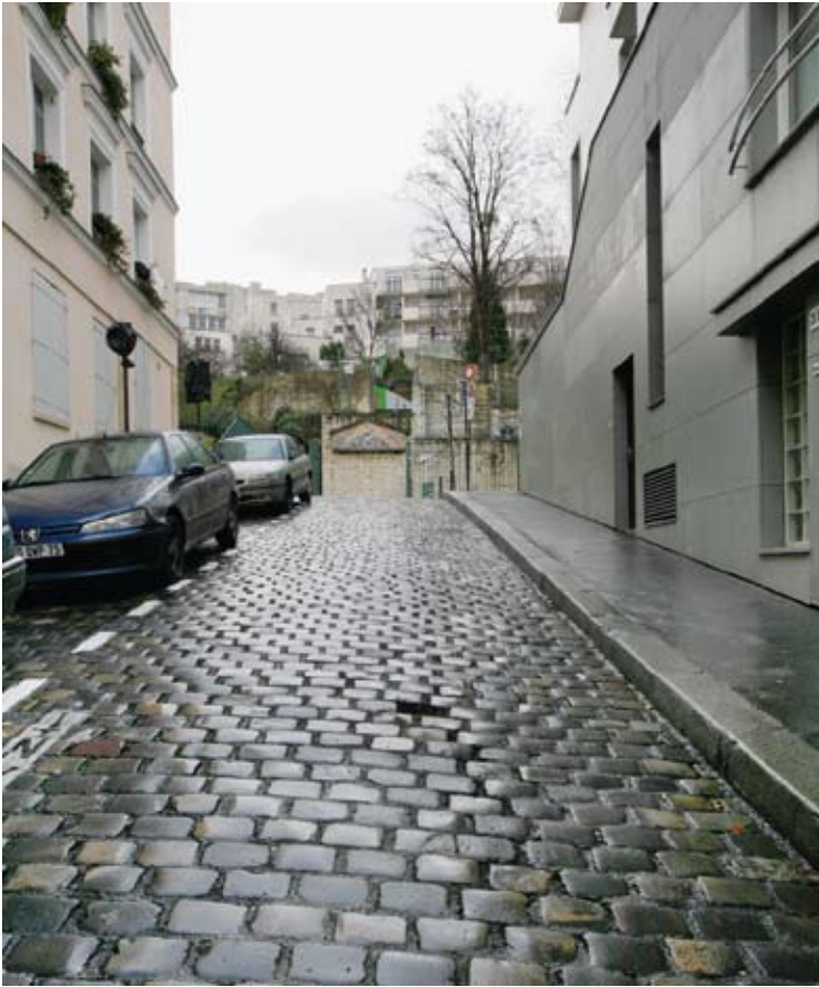
Christoph Weber: „Untitled (rue Rampeau)“, 2008, Lambda print, 25 x 21 cm

wird deutlich, wenn man erfährt, dass das Papiermaché ausschließlich aus Büchern gefertigt ist, die vor dem Revolutionsjahr erschienen sind. Fragestellungen um Fiktion und Realität, um die ambivalente Position zwischen der Idee eines Gegenstandes und der spezifischen Form in Kontext zum umgebenden Raum spielen dabei ebenso eine Rolle wie Reflexionen über die Objektivität persönlicher wie allgemeiner Geschichtsschreibung.