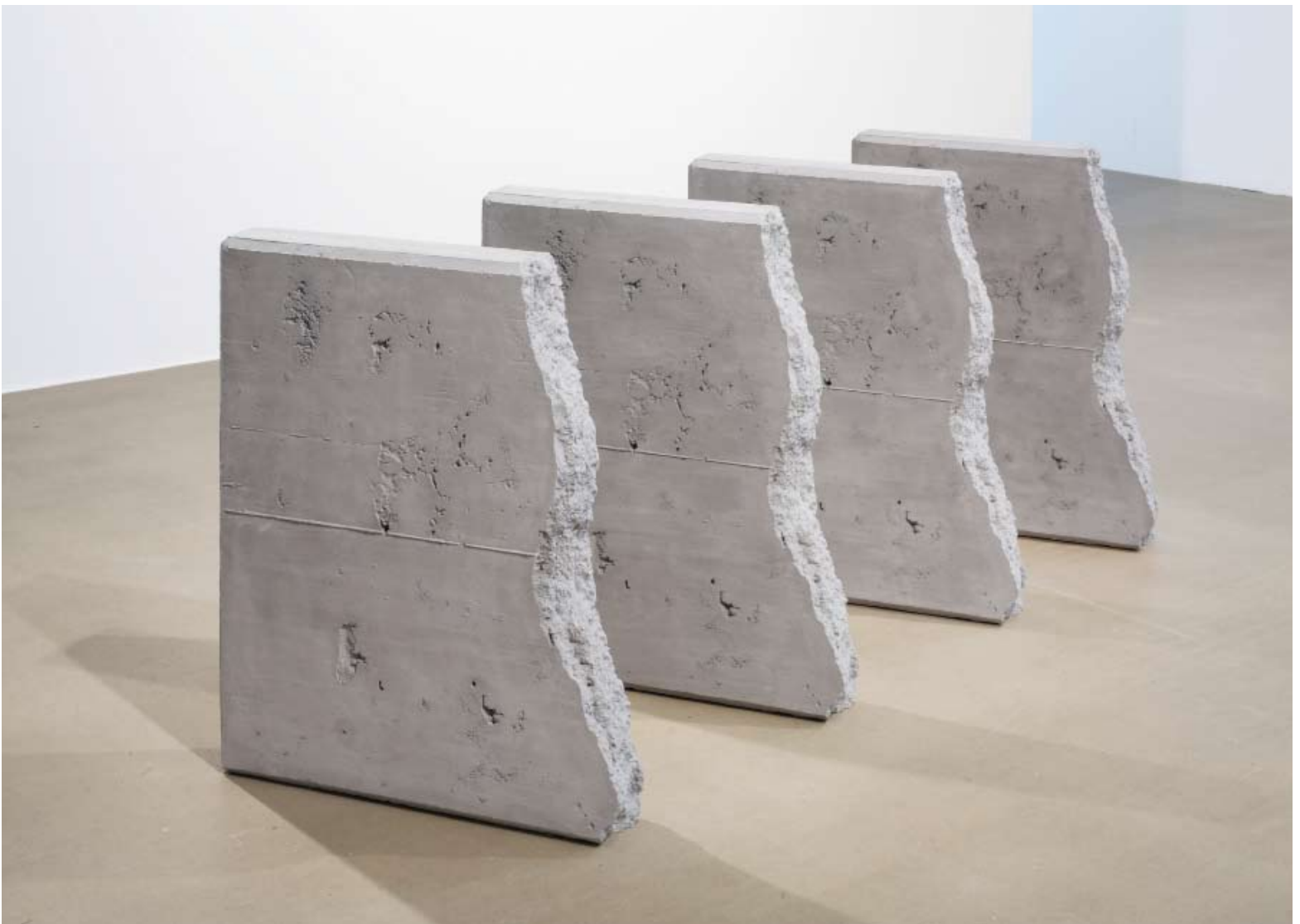
Christoph Weber: „Untitled (Chunks)“, 2004. Sewacryl, je 85 x 70 x 13 cm (Ausstellungsansicht: Kunstraum Niederösterreich, Wien, 2007)

Man mag in der künstlerischen Methodik der Wiederholung von Zerstörung einen Zusammenhang mit der kapitalistischen Wirtschaftstheorie erkennen, die allgemein formuliert davon ausgeht, dass es als Lösung für ökonomische Probleme nur die Vernichtung von Werten, in Form von Zerstörung von Systemen und Märkten gibt, Aufschwung