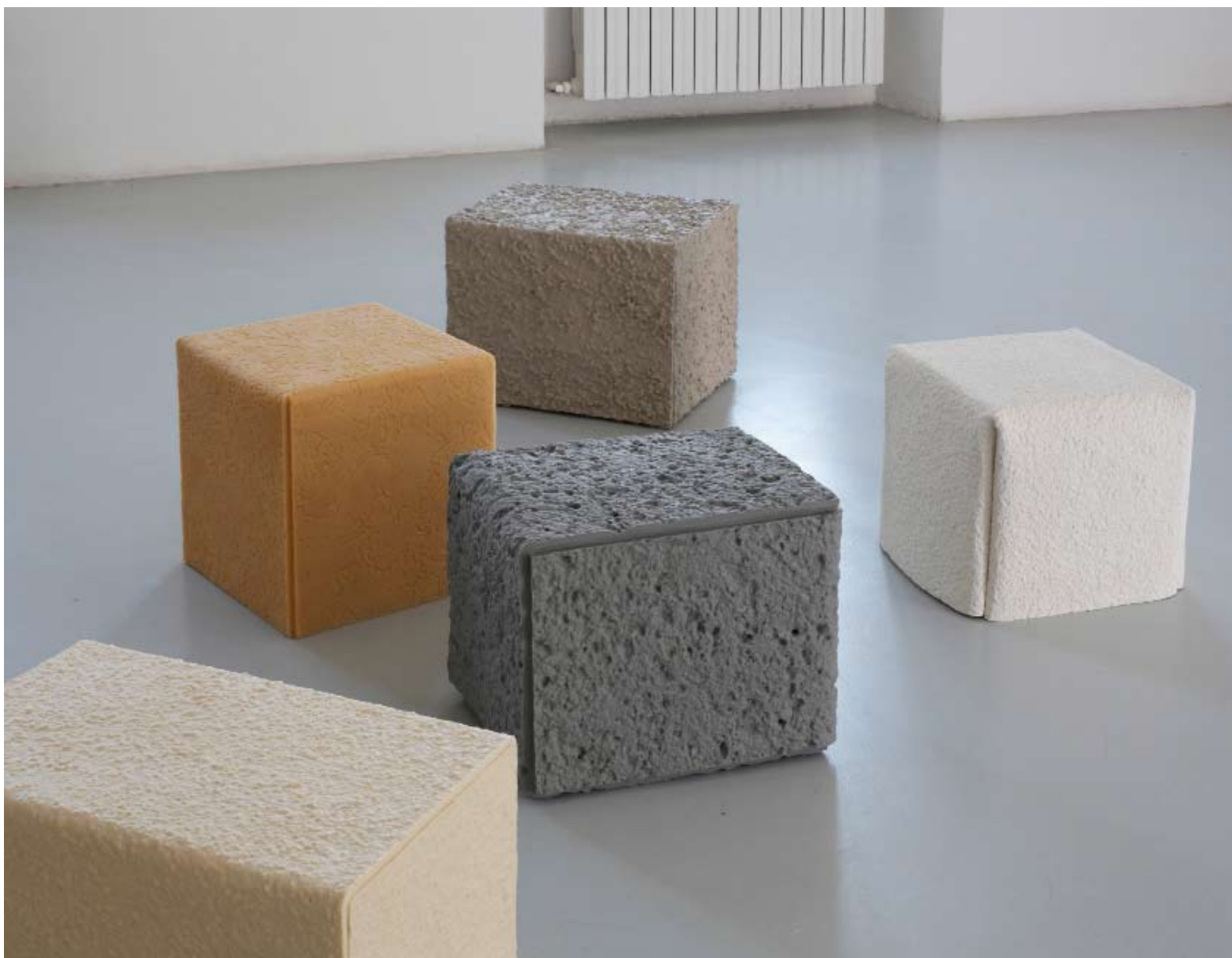
Christoph Weber: „Objets Externes“, 2007. Wachs, Pigment, Dimension variabel (Ausstellungsansicht: Espace de l'Art Concrete, Mouans-Sartoux, Frankreich, 2007)

In seinen „Wandschlitzungen“ bedingt etwa die Vorlage die Technik der Umsetzung. Fotos von zerstörten Architekturen werden auf die Wand übertragen, in dem die Umrisslinien direkt in die Wand gefräst werden. Eine zerstörerische Handlung, die Neues generiert, Fotografie in Raumzeichnung und Grenzbereiche der Architektur und Skulptur transferiert und zugleich den ursprünglich konstruktiven Charakter von Architekturzeichnung ins Gegenteil verkehrt. In einem gleichsam performativen Akt wird durch Zerstörung der ursprünglich auf Repräsentation ausgerichteten Ausstellungswand eine „Zeichnung“ erschaffen, die untrennbar mit der Wand verbunden bleibt. Ein Versetzen in einen anderen räumlichen oder kontextuellen Zusammenhang hätte selbst wieder Zerstörung zur Folge. Ähnlich zu seinen historischen Vorgängern des Minimalismus, des Konzeptualismus oder der Kontextkunst berührt Weber damit Fragestellungen von institutionellen Rahmenbedingungen und deren Repräsentationsformen sowie der verschiebbaren Warenform traditioneller Kunstwerke.