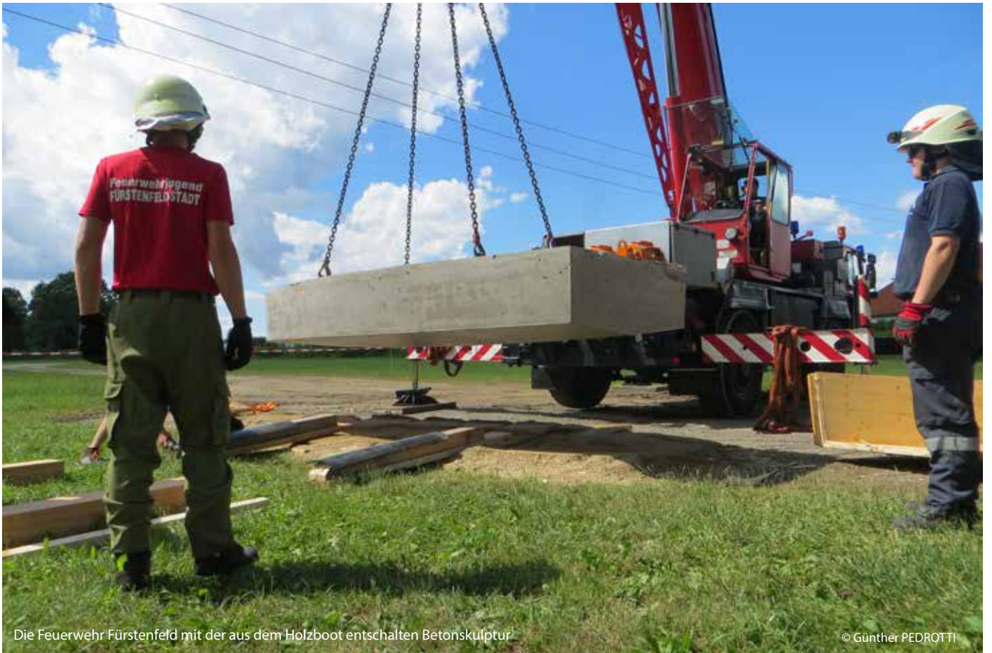
Die Feuerwehr Fürstenfeld mit der aus dem Holzboot entschlachten Betonskulptur