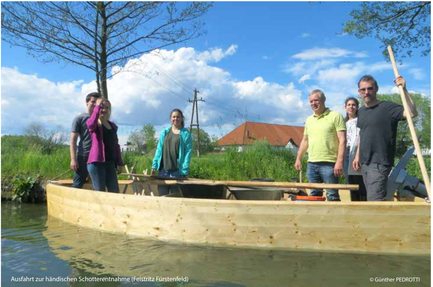
Ausfahrt zur händischen Schotterentnahme (Feistritz Fürstenfeld)