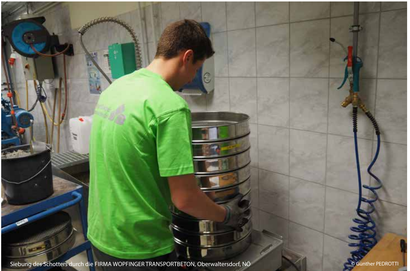
Siebung des Schotters durch die FIRMA WOPFINGER TRANSPORTBETON, Oberwaltersdorf, NÖ