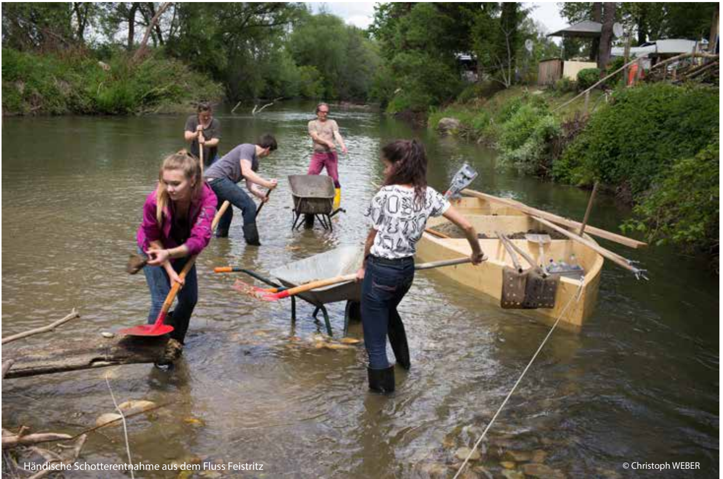
Händische Schotterentnahme aus dem Fluss Feistritz