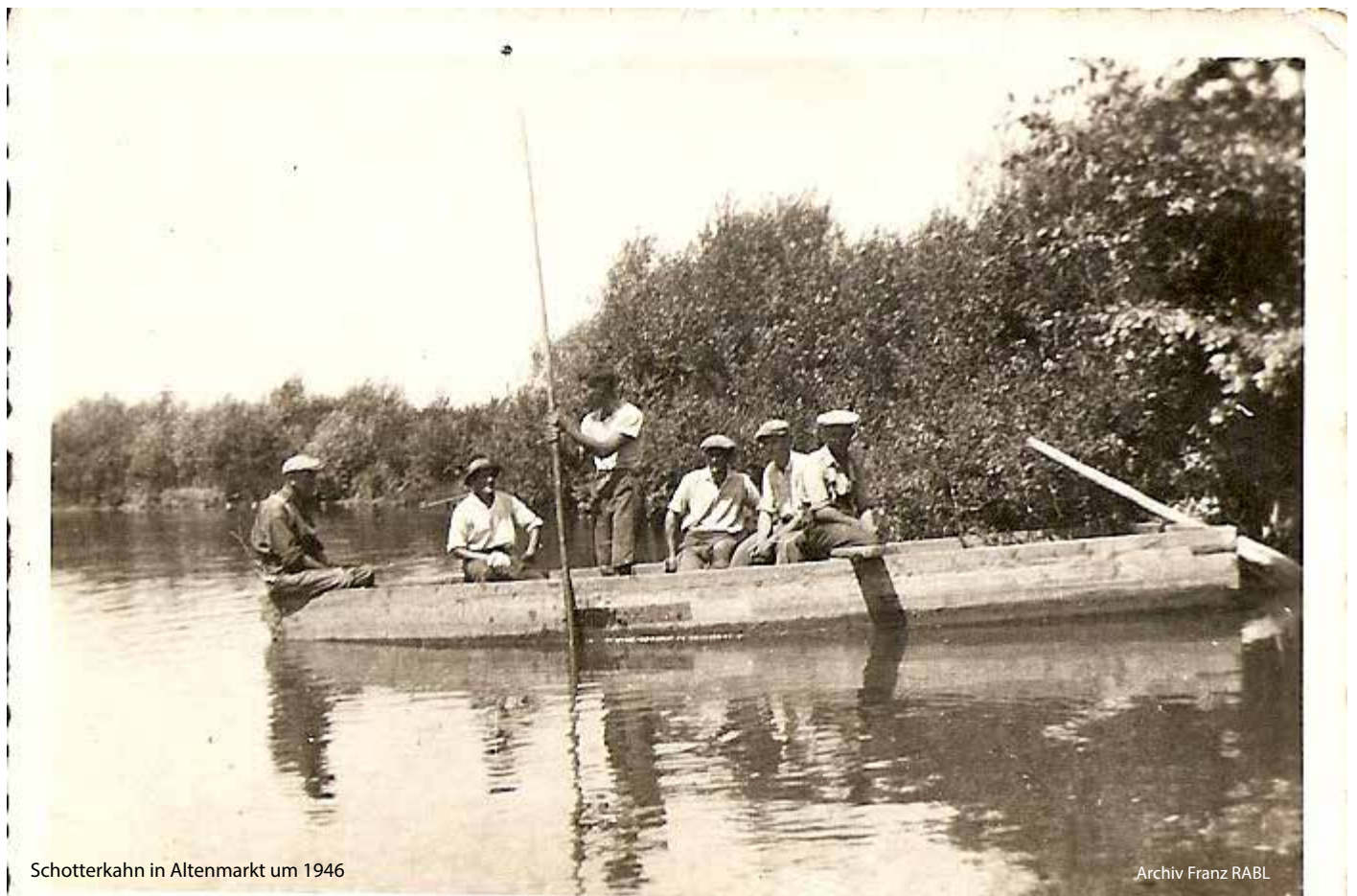
Schotterkahn in Altenmarkt um 1946